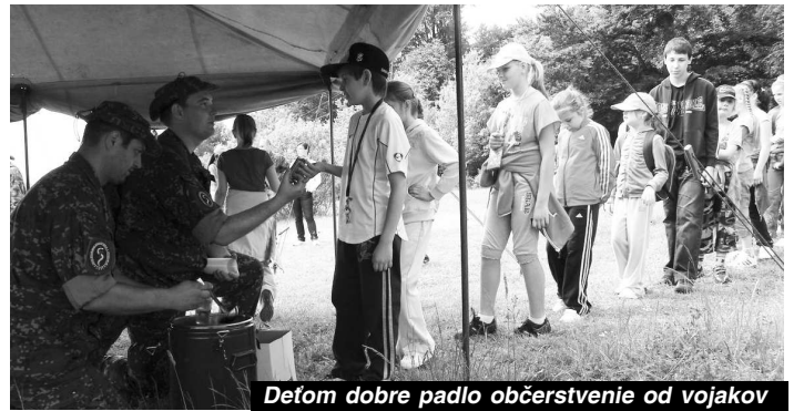
Deťom dobre padlo občerstvenie od vojakov