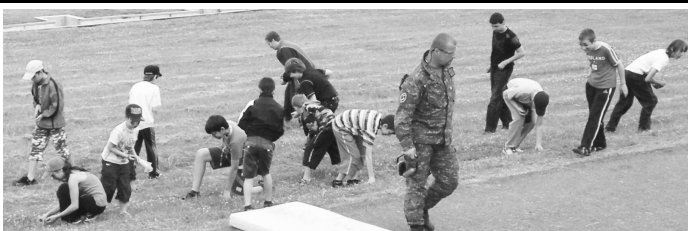
Prázdne nábojnice zo samopalu nazbierané po streľbe budú deťom dobrým suvenírom.