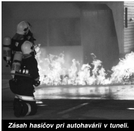
Zásah hasičov pri autohavárii v tuneli.