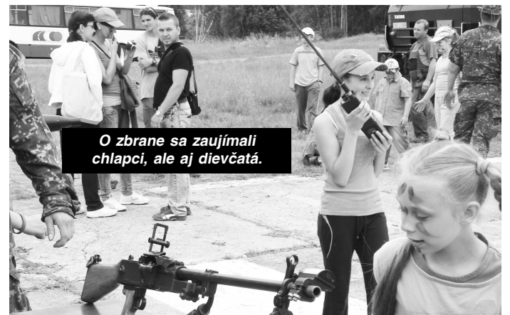
O zbrane sa zaujímali chlapci, ale aj dievčatá.