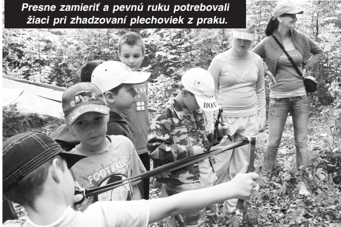
Presne zamieriť a pevnú ruku potrebovali žiaci pri zhadzovaní plechoviek z praku.

páčilo, najviac asi tiež to, keď sme sa učili, ako prežiť v prírode a páčilo sa mi aj na strelnici, kde sme strieľali so samopalom."