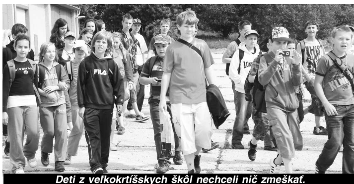
Deti z veľkokrtíšskych škôl nechceli nič zmeškať.