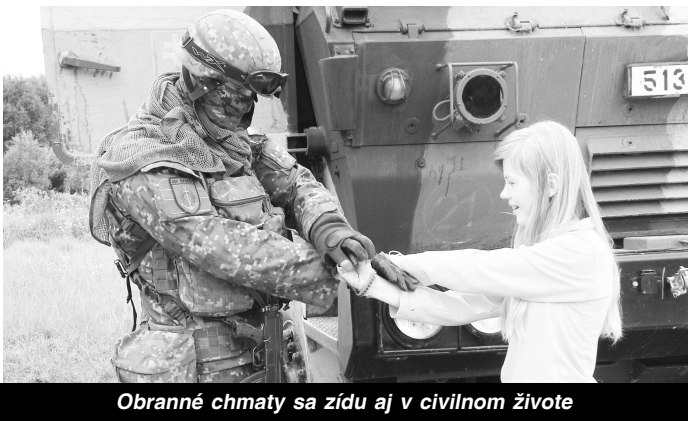
Obranné chmaty sa zídu aj v civilnom živote