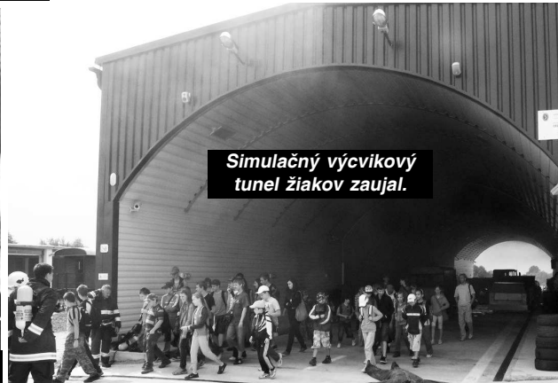
Simulačný výcvikový tunel žiakov zaujal.