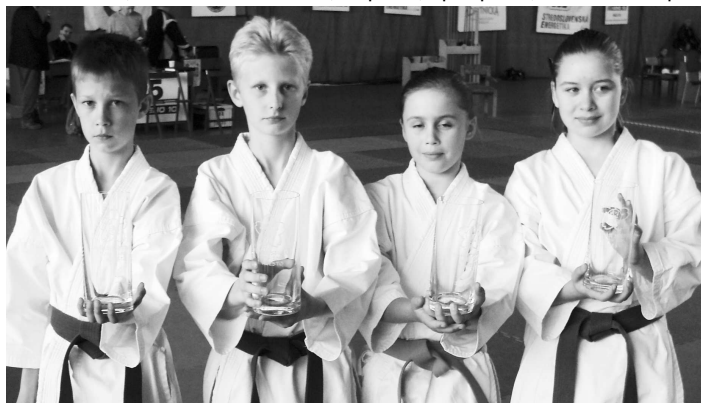
Víťazi päťkolovej súťaže Pohára federácie