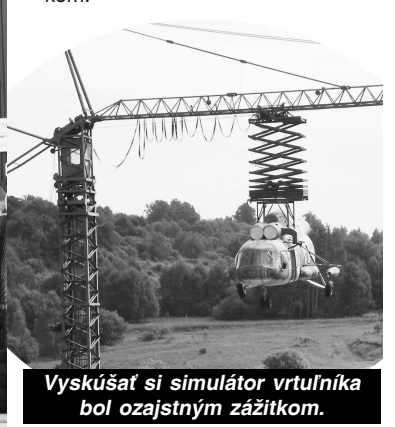
Vyskúšať si simulátor vrtuľníka bol ozajstným zážitkom.