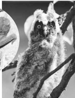
Myšiarka ušatá.