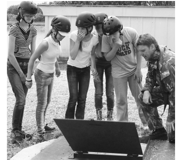
Tam máme vliezť? Čudovali sa dievčatá pri plnení jednej z úloh Bojovej misie

stvom, nasávaním nových zážitkov. Deň detí je na to ako stvorený. Nepochybne je to čas hier, zábav, bezstarostného šantenia počas školského dňa. Pre ZŠ s MŠ Čebovce sa tento sviatok niesol aj v znamení úžasného stretnutia detí so zložkami ozbrojených síl výcvikového priestoru Vojenského obvodu Lešť. Skvelý organizačný výbor, dokonalá harmónia presúvania jednotlivými stanovišťami, možnosť "naživo" si vychutnať atmosféru bojových akcií, všetkými zmyslovými orgánmi v nedočkavosti vnímať a vychutnávať si priebeh záchrany ľudských životov. Nadšenie a hrdosť v očiach detí, sa odzrkadlil pri každom jednom potlesku za predvedené simulácie životných situácií priamo na bojisku. Tiché šepkanie si v "zákulisí" o tom, akí sú všetci vojaci disciplinovaní, zohrať v dokonalej symbióze jednoty tímu, bolo jasným