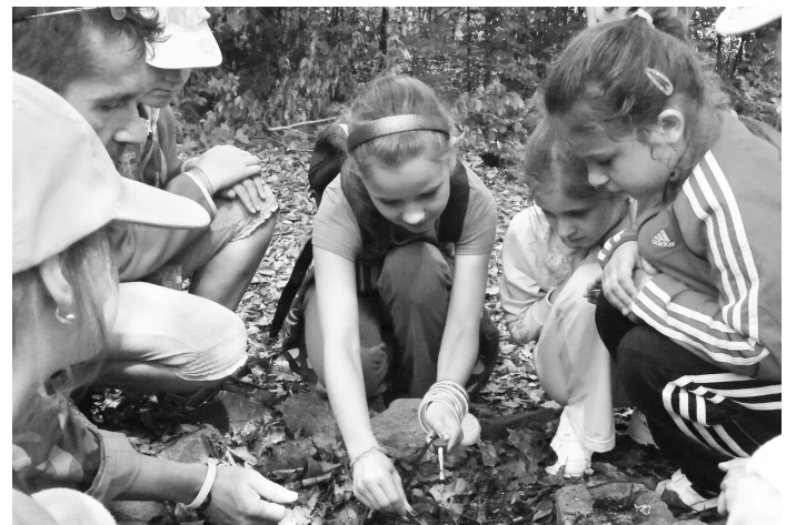
Malí školáci sa naučili ako založiť oheň pomocou kresadla a brezovej kôry