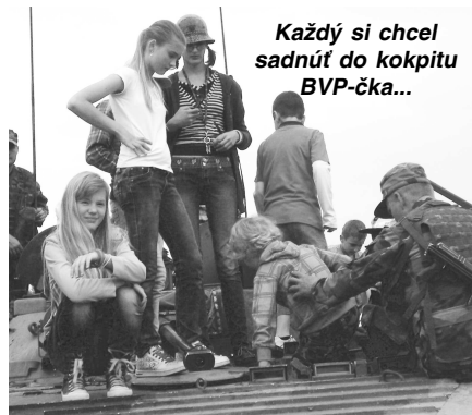
Každý si chcel sadnúť do kokpitu BVP-čka...

V mene všetkých pedagógov a žiakov sa chcem poďakovať celému kolektívu organizátorov, ktorí nám umožnili vstúpiť na územie, sice prísne strážené, ale pre nás sprístupnené a za to, že nám otvoril svoje komnaty a dovolil nám prežiť skvelé chvíľky v prítomnosti skvelých ľudí. Takisto ďakujeme hasičom a najmä záchranárom z Falck-u, ktorí prišli toto podujatie podporiť mimo svoj pracovný čas. Tešíme sa na ďalšie príjemné stretnutia, snáď už aj o rok." -P. GAŠPAROVIČ-