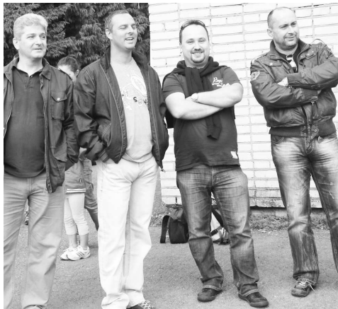
Predstavitelia strany SaS v okrese sa podieľali na organizácii MDD na Lešti.

Menšie deti sa zase učili ako prežiť v divočine. Ako si zapáliť oheň, či uloviť zver kameňom, alebo pracom.