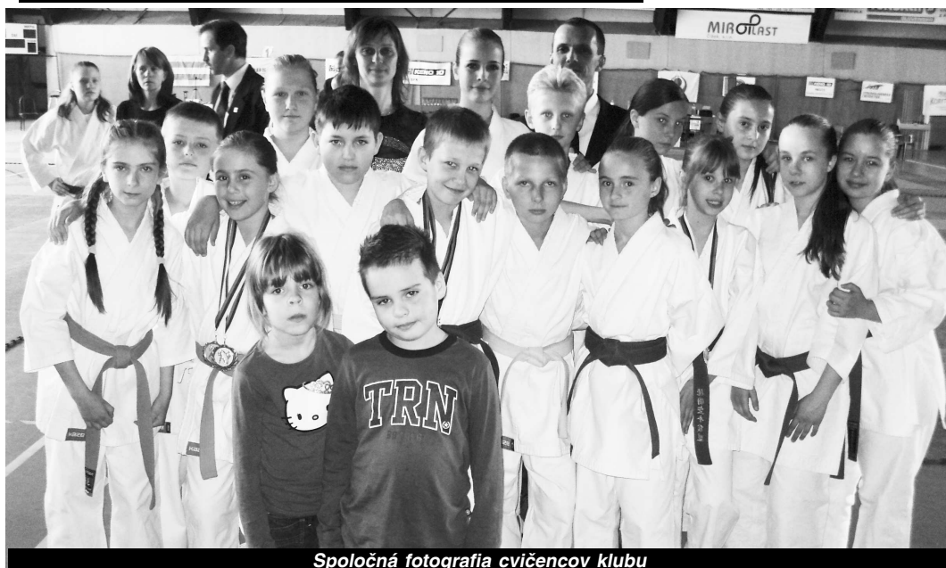
Spoločná fotografia cvičencov klubu