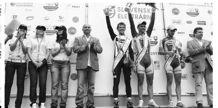
Trojica najlepších v piatej etape pretekov, ktorá mala cieľ vo V.Krtíši, spolu s predstaviteľmi Mesta V.Krtíša a zástupkyňami spoločnosti Technogym, E.E.