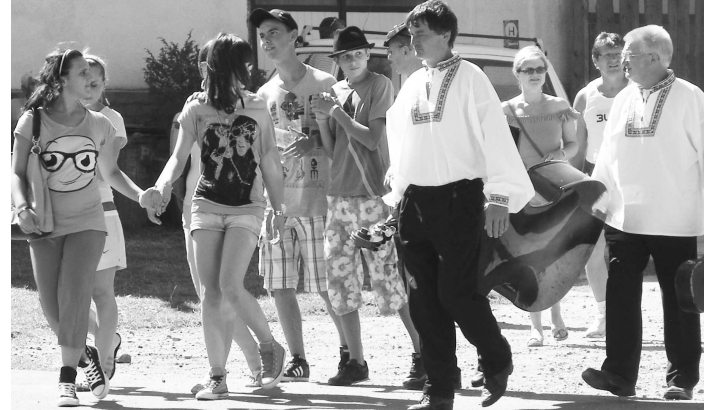
Oblečenie súčasnej mladej generácie sa od krojov našich predkov značne líši.

takom množstve neochutnáte. Podobne ako moravské koláče v Slováckom dvore, kde sa prezentovali obce južnej Moravy. Okrem tradičných koláčov ponúkali návštevníkom na ochutnanie aj ich víno. Kvalitou svojho vína zas lákali do Vinárskeho dvora Zsigmondovci z Vinice a lahodnou vôňou sladkých koláčov privítali návštevníkov v Koláčovom dvore. Nie iba kvôli príjemnému chládku, ale aj pre milú obsluhu a kvalitné koláče, ktoré pripravili ženy z Partnerstva krtíšskeho Poiplia sem mnohí návštevníci radi zavítali. Dobošové, punčové, rodinné a iné rezy, či orechové, makové tvarohové zákusky, ale hlavne štrúdle rôz-