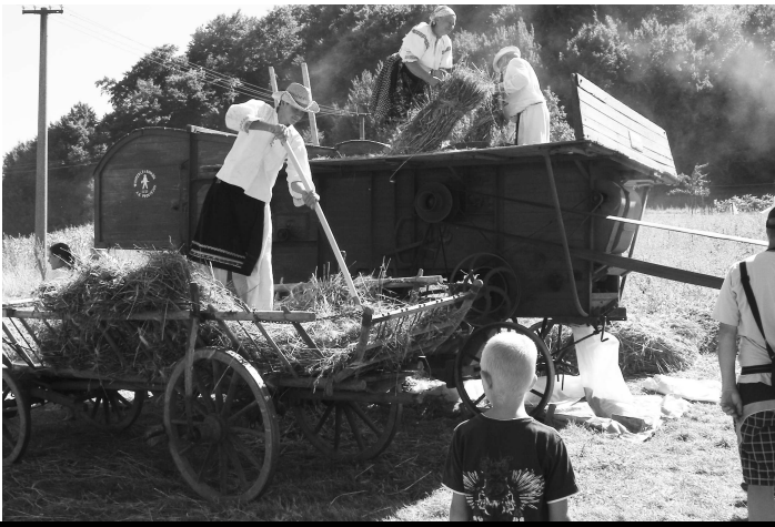
Mlátenie obilia pred rokmi zamestnalo celú rodinu