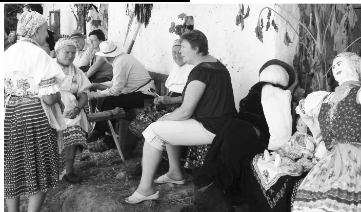
Na Hrušove sa stretávajú známi aj po rokoch a ženy tak ako voľakedy, si rady poklebetia na priedomí.