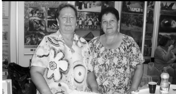
Región Veľký Krtíš v expozícii Banskobystrického kraja úspešne reprezentovalo Občianske združenie z Bátorovej, ktoré v rámci svojich chránených dielní naživo prezentovalo výrobu tkaných kobercov a hotový sortiment výrobkov.