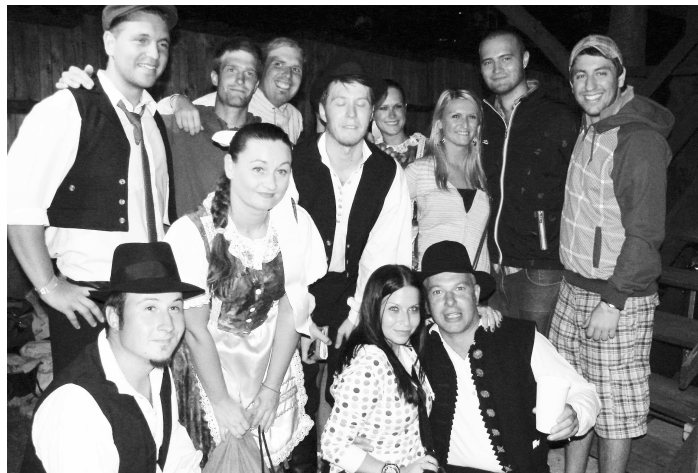
Členovia FS Krtišan sa po úspešnom vystúpení mohli s priateľmi usmievať, i keď niekoľko hodín predtým mali na tréningu ešte riadnu zabračku (na foto dole)