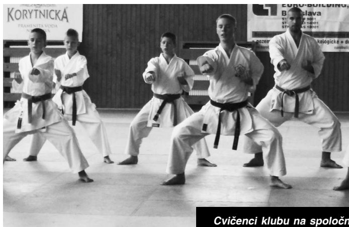
Cvičenci klubu na spoločných tréningoch