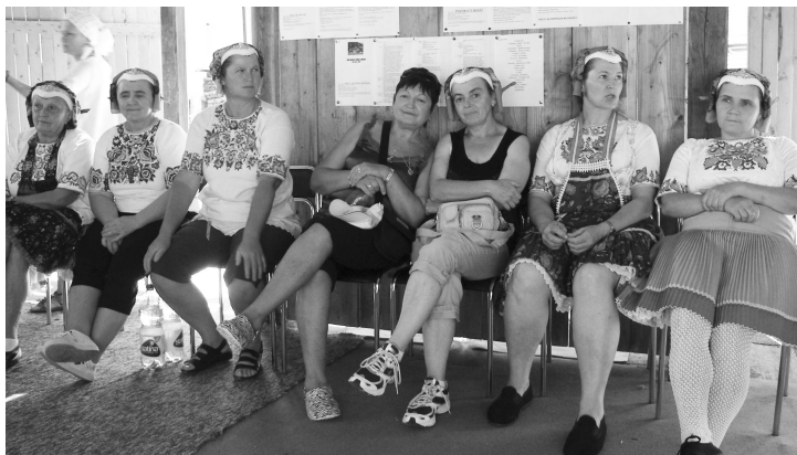
Pri generálke si ženy z Príbeliec a Plachtiniec užívali chvíle pokoja v zákulisí, aby nazbierali sily na hlavné vystúpenie