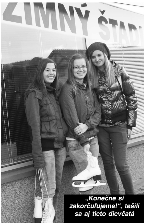
"Konečne si zakorčuľujeme!", tešili sa aj tieto dievčatá