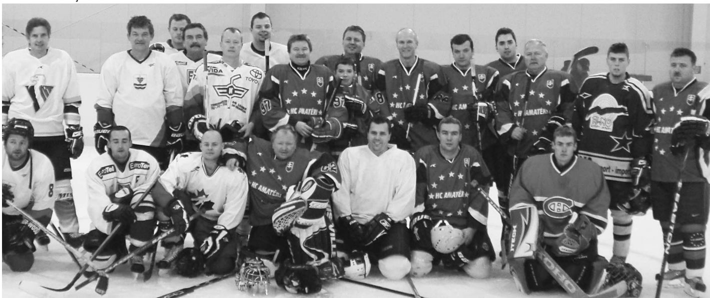
Na novom zimnom štadióne sa predstavili prvý raz pred domácim publikom aj hráči HC Amatéri V. Krtíš.