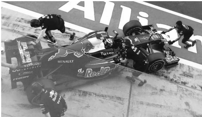
Mať pod balkónom monopost majstra sveta F1, to sa len tak nezažije...

ne v teple. Jediná vec čo nás asi tak nemilo prekvapila bolo to, že všade - či už v hoteli alebo autobuse alebo taxíku - všade bola nastavená klimatizácia na približne 18 stupňov. Preto sme využívali možnosť stráviť čas na zatienenej ale otvorenej streche, kde bolo približne 30-32 stupňov (pripomíname, že VC Abu Dhabi sa jazdila začiatkom novembra). Aj tu bolo o nás výborne postarané, čo sa týka