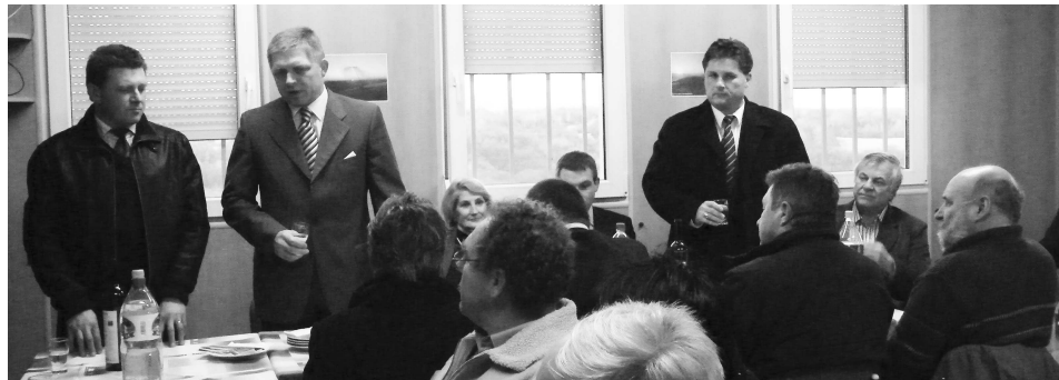
Na stretnutí so starostami z nášho okresu kandidujúcimi za stranu SMER.SD, si mal R. Fico čo povedať.