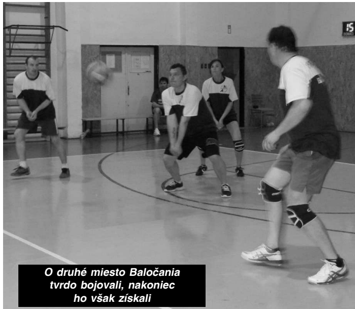
O druhé miesto Baločania tvrdo bojovali, nakoniec ho však získali

Družstvá, v ktorých musia byť na palubovke dve ženy a môžu nastúpiť aj dvaja rodičia, organizátori rozdelili do 3 skupín. V základných skupinách sa mužstvá stretli každé s každým a víťazi skupín postúpili do vyradovacích bojov o konečné poradie. Medzi semifinálistov postúpili aj hráči z radov podnikateľov, ktorí sa v boji o finále stretli s učiteľmi z Balogu nad Ipľom. Podnikatelia, z ktorých viacerí hrávajú, či hrávali za volejbalový klub Pollar V. Krtíš si so snaživými Baločanmi poradili a čakali na víťaza druhého semifinále medzi Gymnázium a I. ZŠ. Do finále po tuhom boji nakoniec postúpili mnohonásobní víťazi tohto tur-