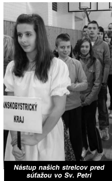
Nástup našich strelcov pred súťažou vo Sv. Petri