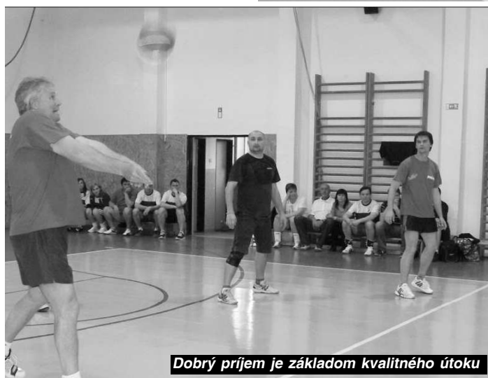
Dobry príjem je základom kvalitného útoku