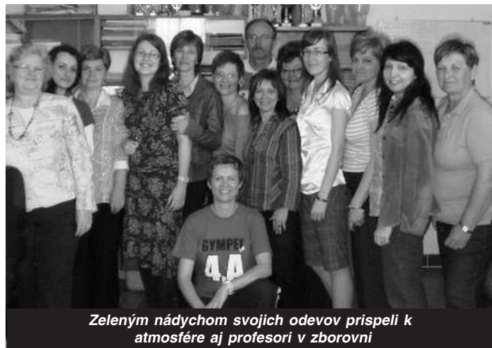
Zeleným nádychom svojich odevov prispeli k atmosfére aj profesori v zborovni