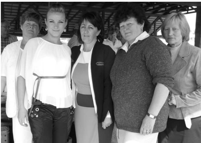
Pracovníčky firmy Korpod sa na jeden deň zmenili na hostesky, aby pre hostí pripravili skvelé pohostenie