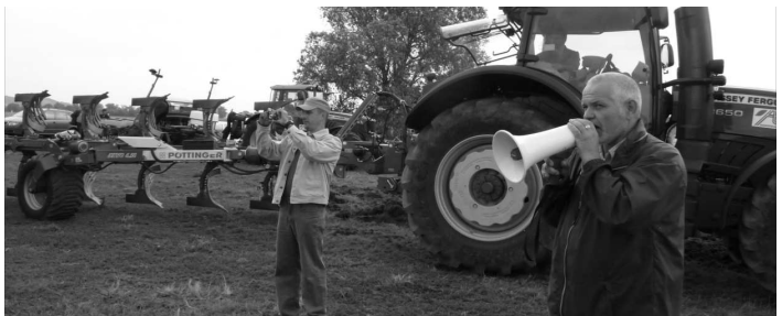
Najmodernejšia technika brázdí a obrába aj polia v okrese Veľký Krtíš.