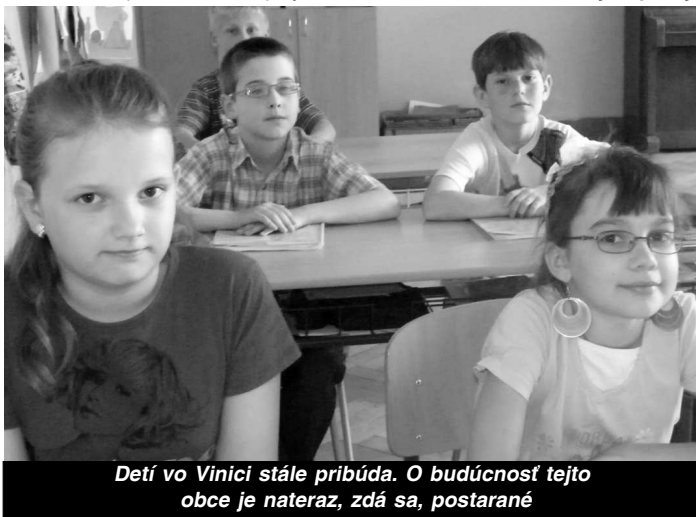
Deti vo Vinici stále pribúda. O budúcnosť tejto obce je nateraz, zdá sa, postarané

K eby sme hodnotili minulý rok, pre Vinicu bol mimoriadne úspešným projekt Európa občanom, vďaka ktorému v prvom polroku bola organizátorom stretnutia deviatich obcí zo 4 krajín (Slovenska, Maďarska, Slovinska a Rumunska). Pokračujúci projekt zahŕňal usporadúvanie regionálnych podujatí, hlavne v oblasti kultúry až do tohto roku, usporadúvanie výstav ľudových zvykov krajín zúčastnených v projekte, rozvoj a podpora ľudovej kultúry a turizmu, obnovenie a prezentácia tradičných remesiel. Na pamiatku tohto projektu