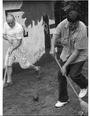
Tatovia modrokamenských škôlkarov sa predviedli v netradičných disciplínach. Všetky hravo zvládli, vrátane zapletania vrkočov svojim dcérkam.