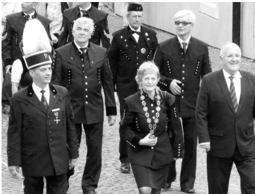
V čele sprievodu medzi baníkmi spolu s primátorkou B. Štiavnice kráčali i vzácní hostia

To je tiež jeden z dôvodov, kvôli ktorému sa aj vo