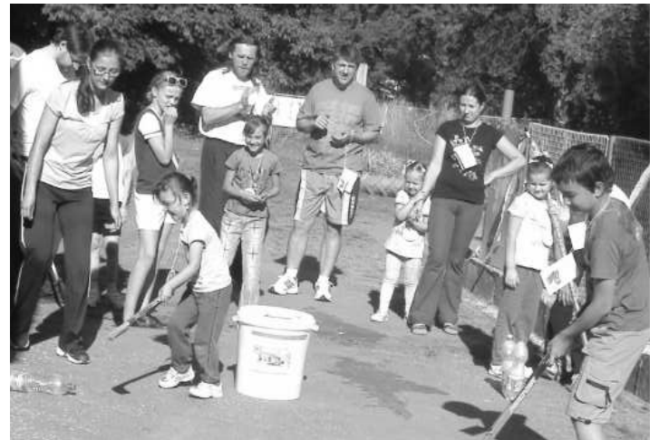
Otcovia si so svojimi ratolesťami užili kopec zábavy

Nasledovalo plnenie súťažných úloh na stanovištiach, súťažilo sa v družstvách v hokejbale, vo volejbale, v slalome s fúrikmi a na motorkách, rúcali kolký, prekonávali prekážky cez lavičku a prelievali prackážky cez lavičku a prelievali vodu, chytali ryby. Poslednou disciplínou "hry s pieskom" sa ockovia na chvíľočku stali deťmi a spoločne so svojimi ratolesťami stavali hrad v piesku. Ich deti stavali hradby a ockovia z bábovkových a zmrzlinových formičiek vytvárali, krásny strednoplachtinský hrad, v ktorom