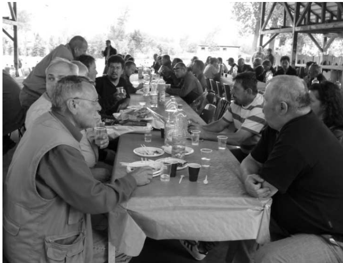
Pred cestou na polia sa všetci výdatne posilnili

"Množíme 15-20 odrôd osív na rozlohe okolo 300 ha a to za rovnakých podmienok, aké majú poľnohospodári aj inde v našom okrese. Znamená to, že polička vôbec nezavlažujeme, ani inak špeciálne neupravujeme - naše osivá vyrastajú v reálnych podmienkach, ako majú ostatní. U nás idú na predaj najmä osinaté obilniny (pre laikov na vysvetlenie majú drobné ostne, pozn. red.) kvôli čomu nie sú vhodnou potravou pre divú zver, ktorej je v našom regióne pozhnané."