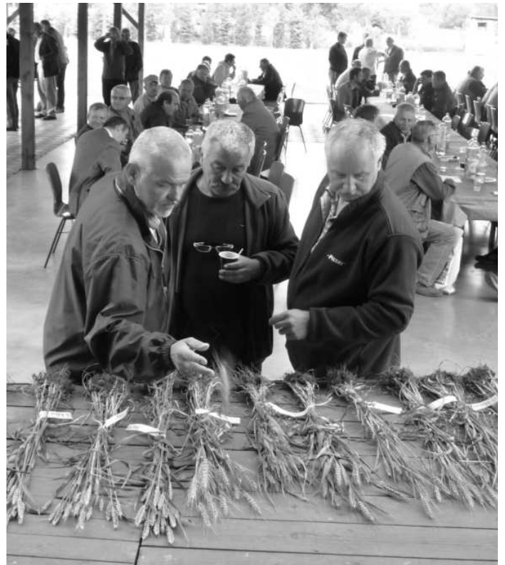
Vzorky obilnín z poľa prevádzkových - pokusných poličok sme mohli porovnať aj poukladané vedľa seba