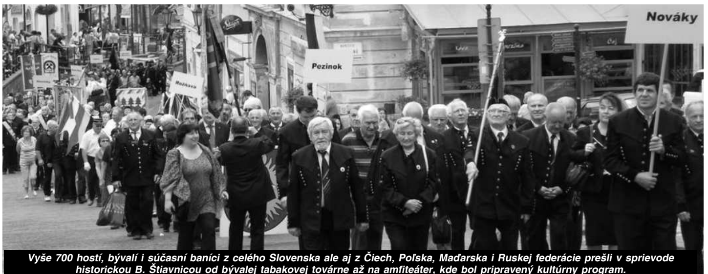
Vyššie 700 hostí, bývalí i súčasní baníci z celého Slovenska ale aj z Čiech, Poľska, Maďarska i Ruskej federácie prešli v sprievode historickou B. Štiavnicou od bývalej tabakovej továrne až na amfiteáter, kde bol pripravený kultúrny program.