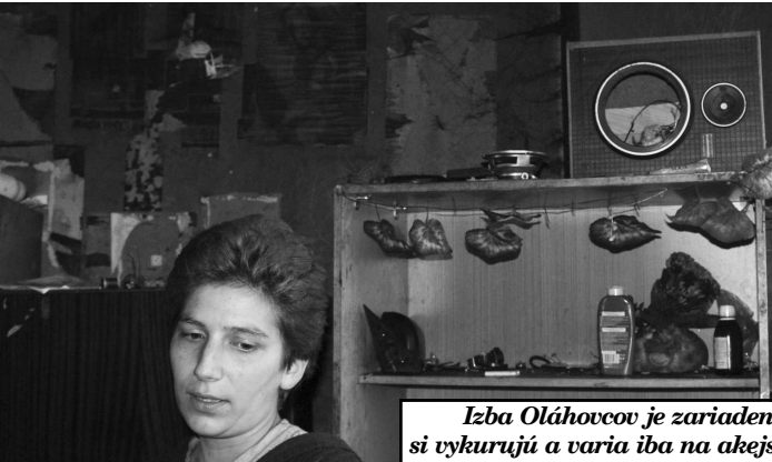
Izba Oláhovcov je zariadená veľmi skromne a v miestnosti si vykurujú a varia iba na akejsi piecke urobenej z plechového suda