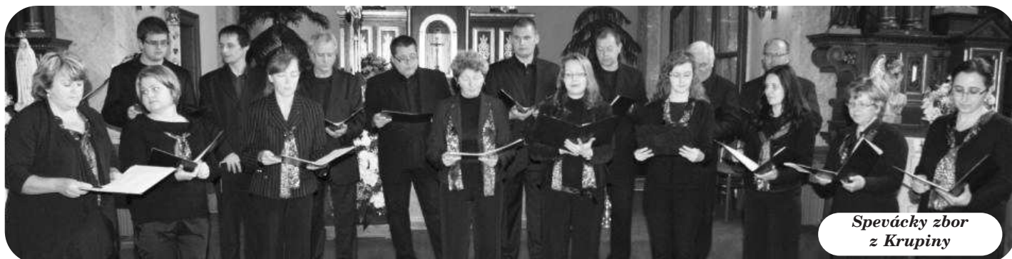
Spevácky zbor z Krupiny