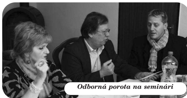
Odborná porota na seminári