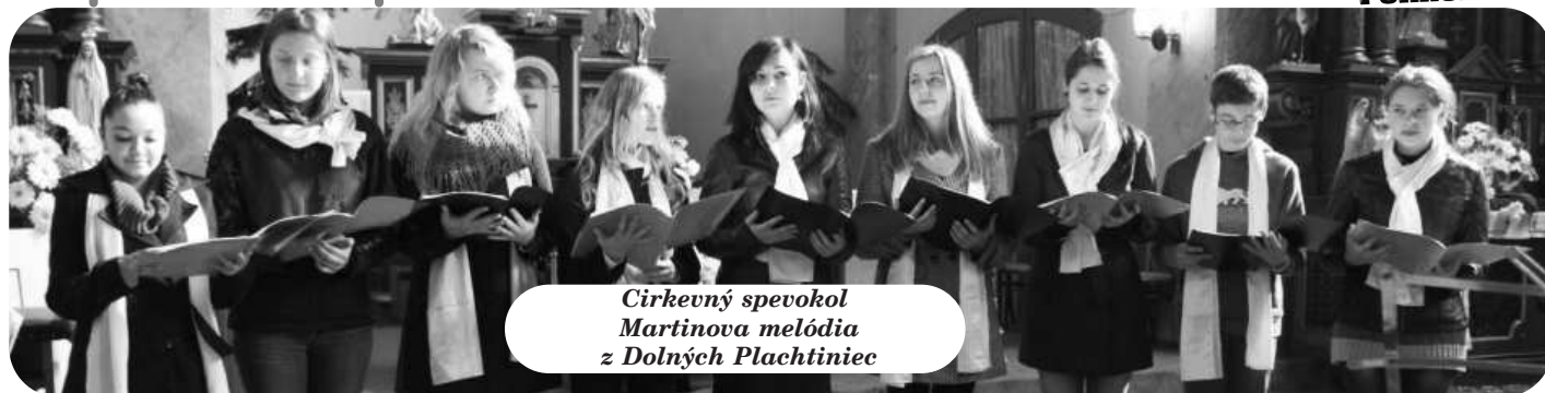
Cirkevný spevokol Martina melódia z Dolných Plachtiniec