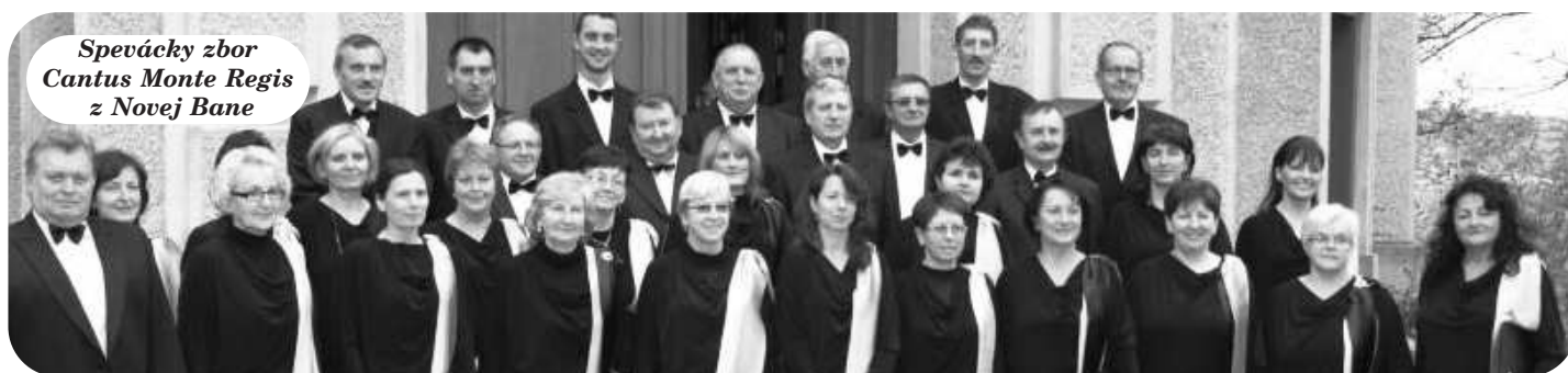
Spevácky zbor Cantus Monte Regis z Novej Bane