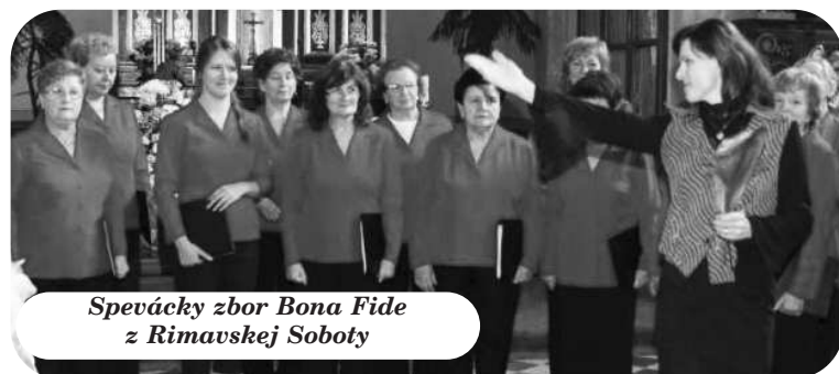
Spevácky zbor Bona Fide z Rimavskej Soboty