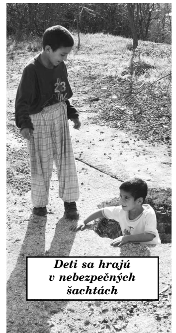
Deti sa hrajú v nebezpečných šachtách