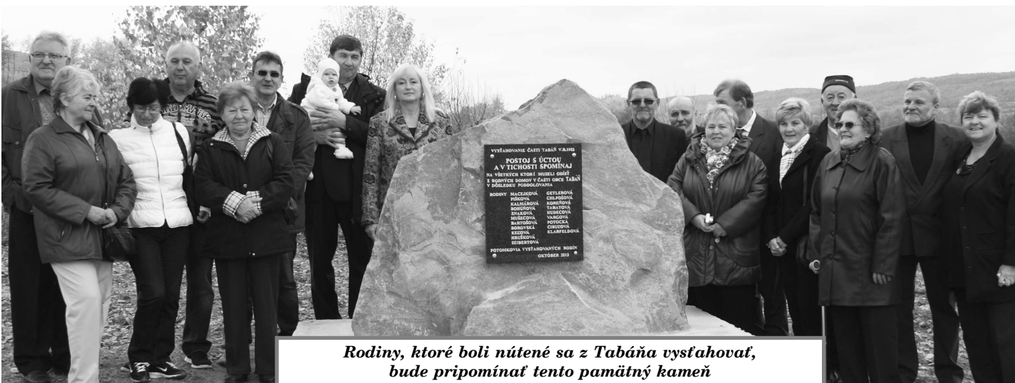
Rodiny, ktoré boli nútené sa z Tabáňa vysťahovať, bude pripomínať tento pamätný kameň