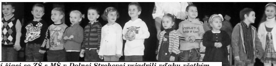
Mladší žiaci so ZŠ s MŠ v Dolnej Strehovej vyjadrili vďaka všetkým starým rodičom pekným kultúrnym programom

Text : - MARTA KMINIAKOVÁ -