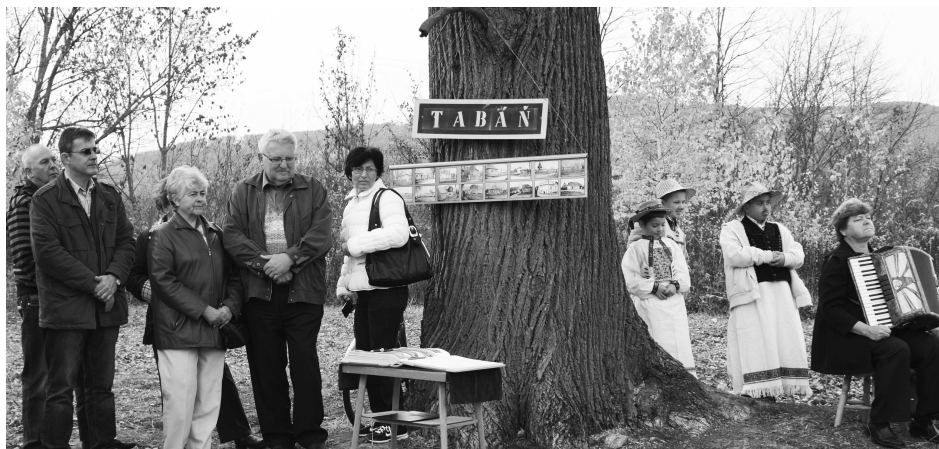
Symbolom Tabáňa sa stala vari 300-ročná mohutná lipa, okolo ktorej sa zišli bývalí obyvatelia i dnešná mládež D. Strháru