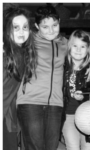
Ulicami Veľkého Krtíša sa niesla strašidelná, ale aj tak veselá atmosféra